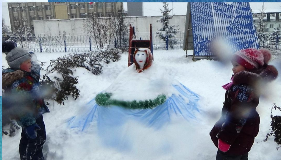
Попади Матрешке в корзинку.