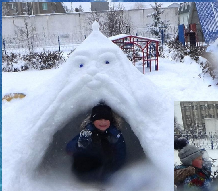
Черномор на участке старшей группы – для подлезания